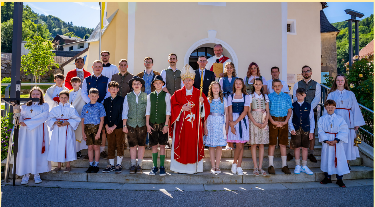
Reinsberger Firmlinge 2024