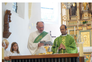
Bedankung & Neuaufnahme