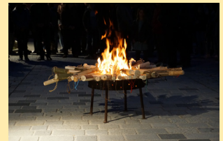
Prügelweihe Osternacht 30. März