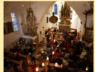
Martinsfest 11. November