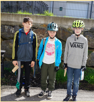
Karfreitagratschen 29. März