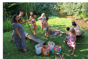
Grill- & Badenachmittag