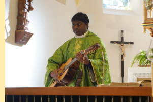
Hl. Messe 29. September