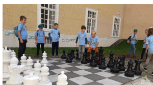
Kinder- und Erlebnistag im Stift Seitenstetten