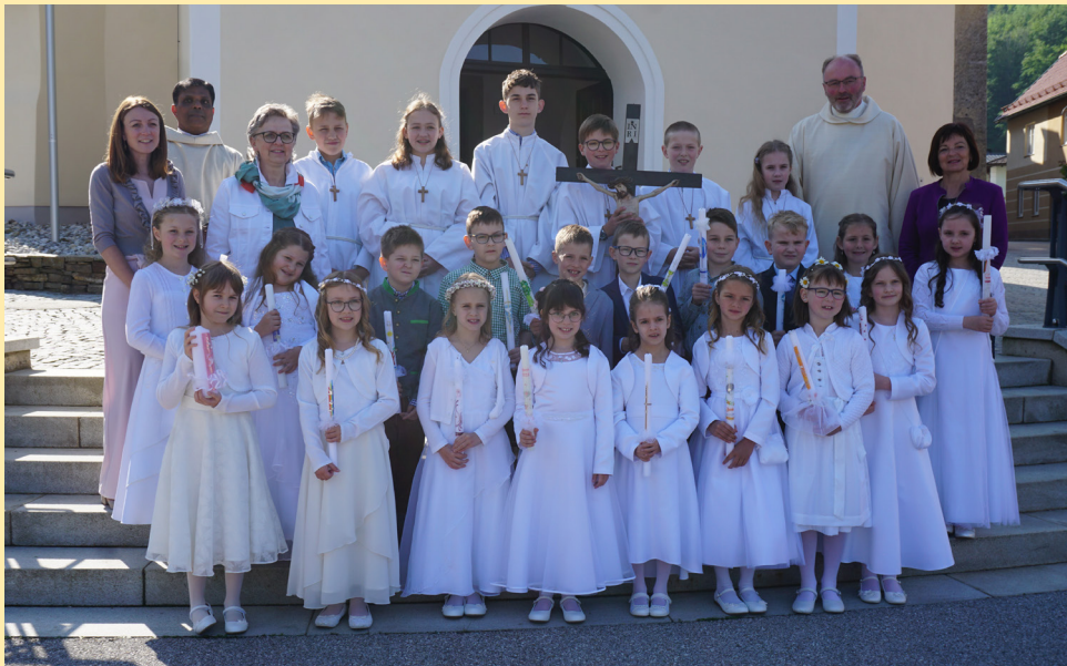
Reinsberger Erstkommunion- kinder 2024