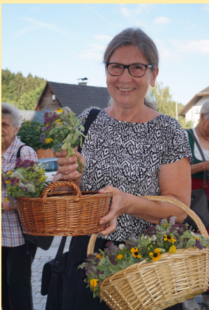
Kräuterbüschchen 15. August