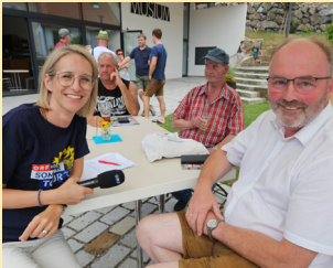
Radio NÖ Sommertour