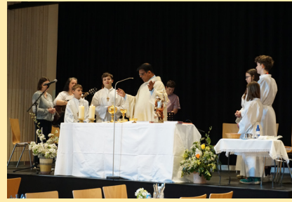
Hl. Messe Feuerwehr- frühschoppen 7. April