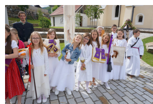
Fronleichnam - Ministrantenfest