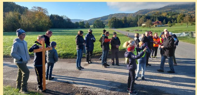
Feichsenbeten 12. Oktober