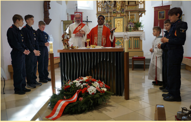
Florianikirchgang 5. Mai