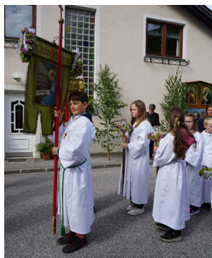
Fronleichnam - Ministrantenfest