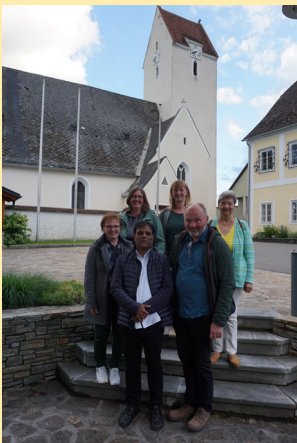
Dekanatsausflug Artstetten und Neukirchen am Ostrong am 13. Juni